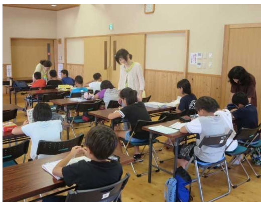
学習の見守り支援